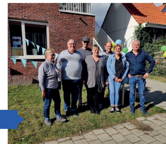
Dankjewel aan het buurtcomité voor zoveel inzet