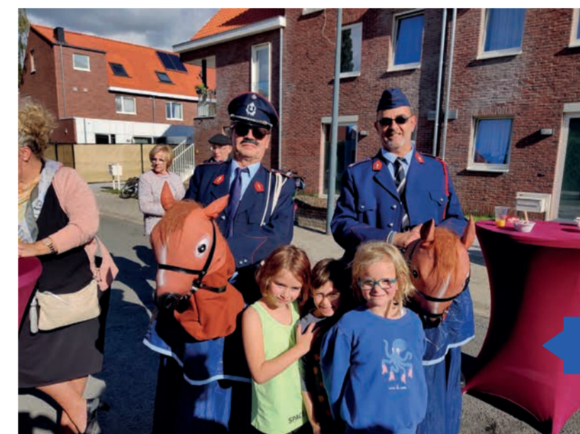
Alles onder controle met de Vliegeladjudanten 🤖

Woon je in de buurt? Volg Buurtwerk Gulden Vellekens op Facebook en doe mee!