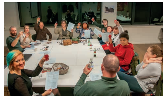
Deze groep is al ingeschreven

Heb je interesse? Kom zeker langs en volg hen op Facebook: Cohousing Land van Aa.