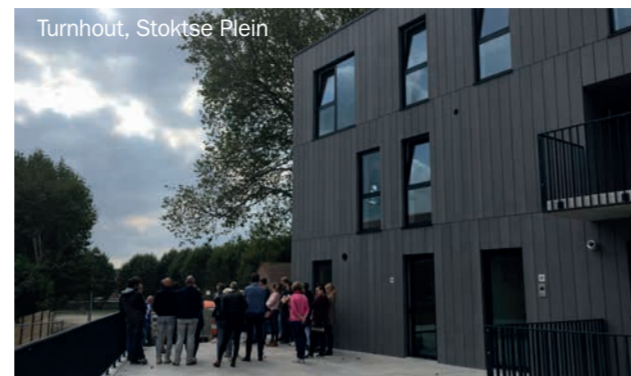
Turnhout, Stokte Plein