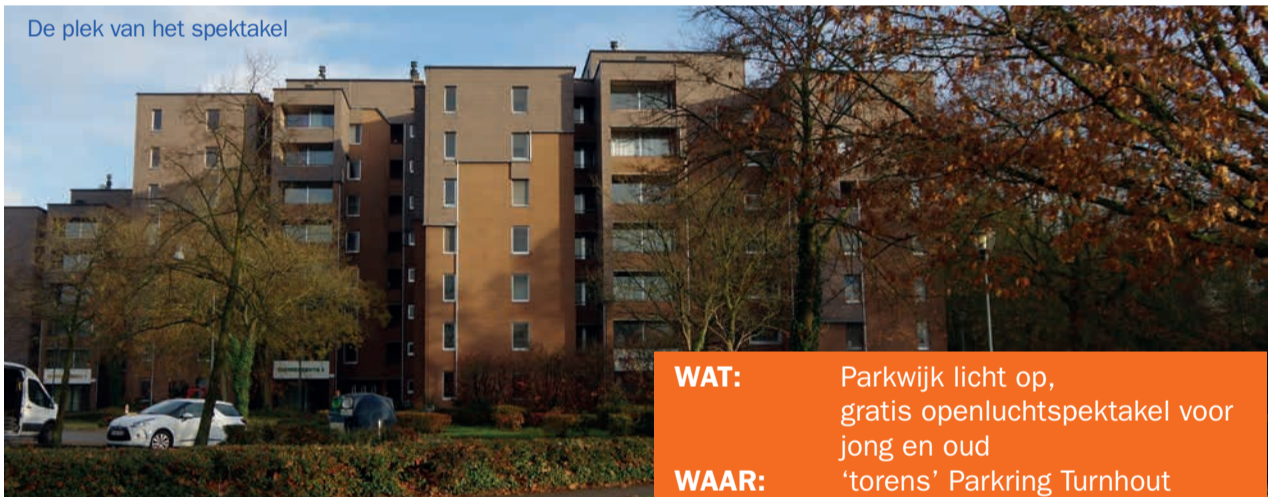
De plek van het spektakel

WAT: Parkwijk licht op, gratis openluchtspektakel voor jong en oud WAAR: 'torens' Parkring Turnhout WANNEER: donderdag 23 april van 20u tot 22u