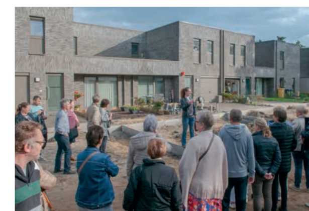
Rondleiding in de buurt

Op zondag 13 oktober vierden we in heel Vlaanderen 100 jaar sociaal wonen. DE ARK vierde mee in Dessel, samen met bezoekers, bewoners en medewerkers. Een gezellige zonnige dag!