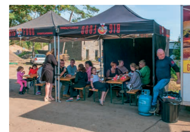
En natuurlijk... frieten voor iedereen!