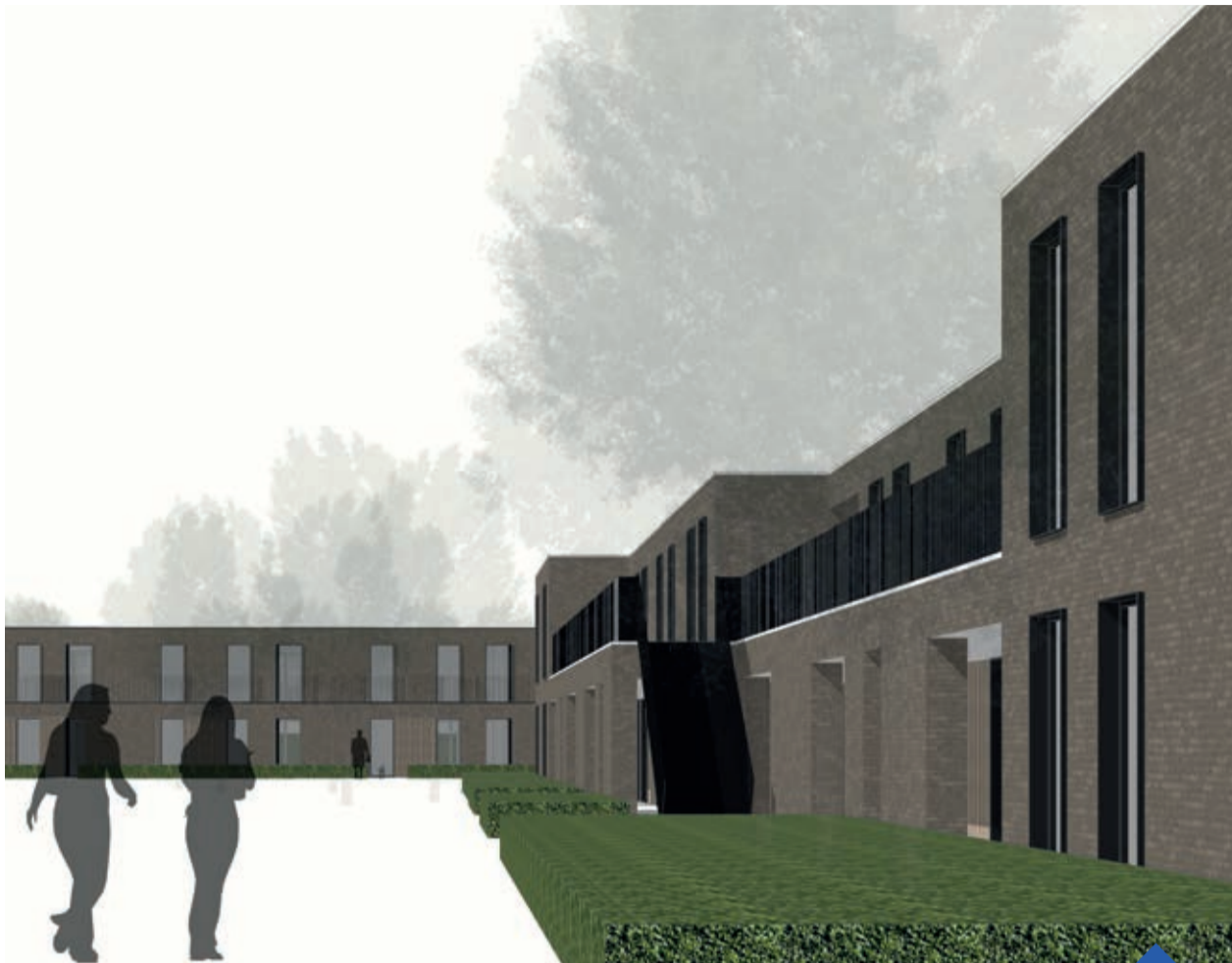
Bescheiden huren in de Begonialaan. beeld: FCS ARCHITECTEN