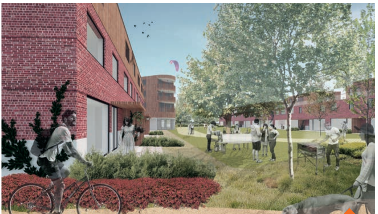
Sfeerbeeld van Land van Aa beeld: DAM architecten

Begin 2018 erkende de Vlaamse Overheid ons cohousingproject als 'proefomgeving'. Dit betekent dat we iets mogen afwijken van de wetgeving sociaal wonen. Om in te schrijven moet je wel voldoen aan de standaardvoorwaarden voor kopers of huurders. Maar je hebt meer kans om hier te wonen als je je engageert. Dit bewijs je door actief aanwezig te zijn op vergaderingen en