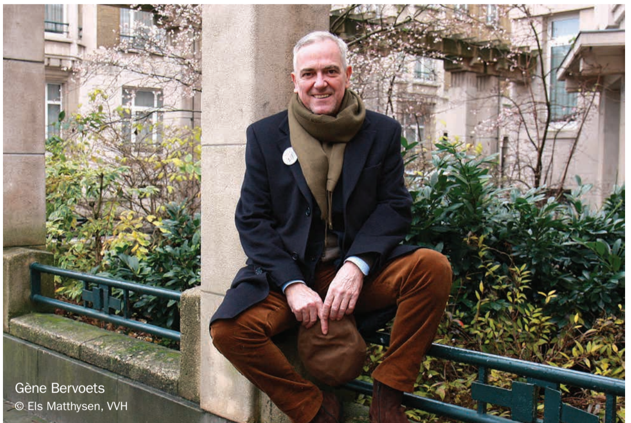
Gène Bervoets

We brengen je graag een fragment uit het boek, over Gène Bervoets. In de volgende Woonkriebels ontdek je quotes van andere BV's.