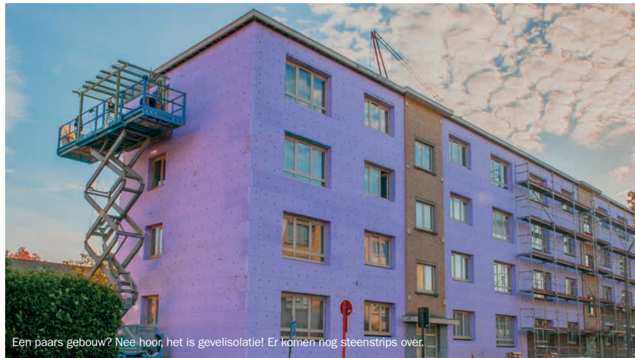
Een paars gebouw? Nee hoor, het is gevelisolatie! Er komen nog steenstrips over.