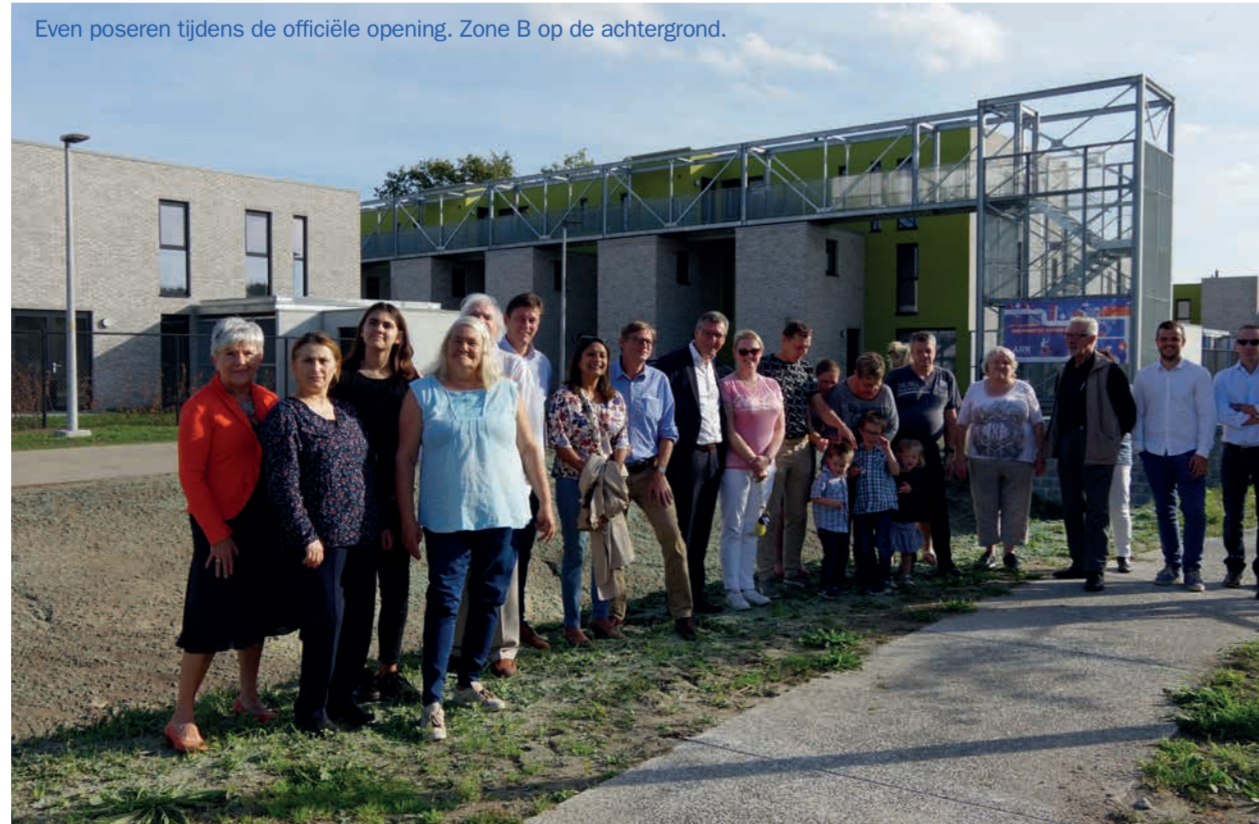
Even poseren tijdens de officiële opening. Zone B op de achtergrond.