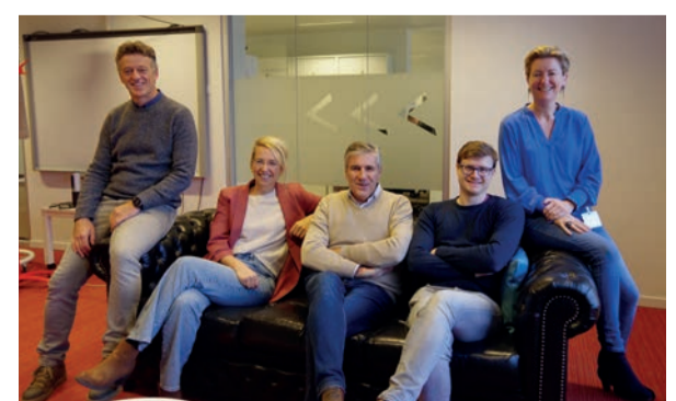
Het nieuwe Management Team van Woonboog

Het team Patrimonium bestaat onder andere uit de techniekers die bij jou thuis herstellingen doen. De planner die alle afspraken regelt krijg je aan de telefoon. Andere medewerkers van Patrimonium zie je dan weer op werven en in bewonersvergaderingen. Je komt ons dus zeker wel eens tegen!