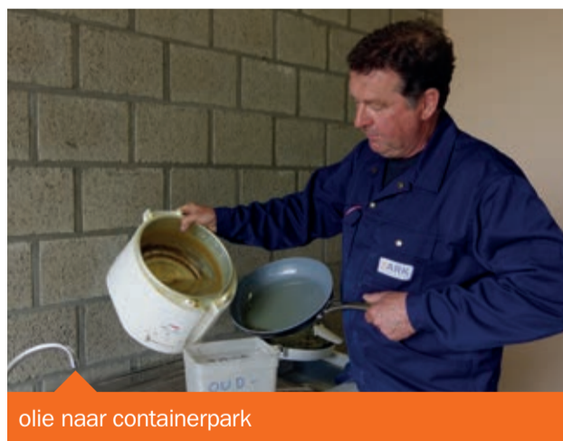
olie naar containerpark