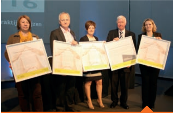
Onze manager klantenrelaties en projectontwikkeling nam de prijs in ontvangst

Eén van die goede praktijken is ons verhuisbegeleidingsplan bij totaalrenovaties . DE ARK heeft een uitgebreide renovatieplanning. We begeleiden onze huurders zo goed mogelijk als hun huis gerenoveerd wordt. De Visitatieraad waardeert deze totaalaanpak en belooft ons met een 'Beste-praktijkprijs'.