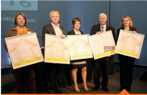
Onze manager klantenrelaties en projectontwikkeling nam de prijs in ontvangst

Eén van die goede praktijken is ons verhuisbegeleidingsplan bij totaalrenovaties . DE ARK heeft een uitgebreide renovatieplanning. We begeleiden onze huurders zo goed mogelijk als hun huis gerenoveerd wordt. De Visitatieraad waardeert deze totaalaanpak en belooft ons met een 'Beste-praktijkprijs'.