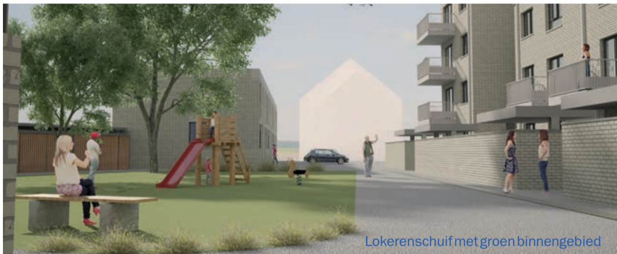
Lokerenschuif met groen binnengebied