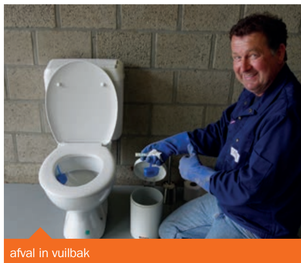
afval in vuilbak