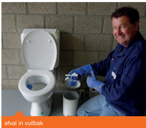
afval in vuilbak